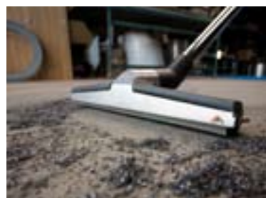
Rengøring af gulvarealer. Rengøring under arbejdsborde. Rengøring under rullebånd. Rengøring mellem borde, reoler etc. Altid i kun én arbejdsgang.

kilden. Derfor bliver det lettere for virksomheden at holde støvniveauet på et acceptabelt niveau. En sådan løsning giver et bedre indeklima, medvirker til mere trivsel - og formentlig også mindre sygefravær blandt medarbejderne” .