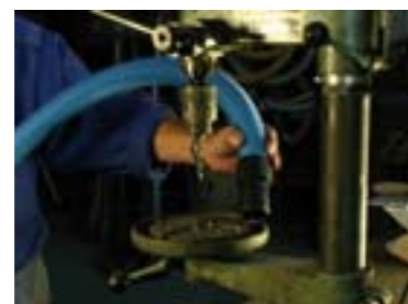
Rengøring af produktionsudstyr som boremaskiner, drejebænke, fræsere, save, støbemaskiner, slibemaskiner o.lign. Det er nemt at fjerne affaldet direkte ved kilden - efterhånden som det opstår