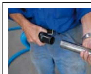
Alt udstyr er konstrueret, enkelt og logisk, så det er let at betjene for alle i virksomheden.