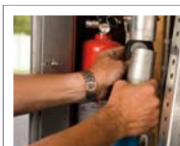
Anlægget starter automatisk når slangen monteres og stopper straks når slangen fjernes igen.