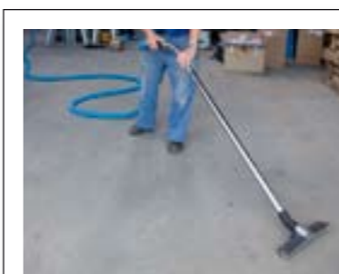
Den lette og fleksible slange rækker langt – så hver en krog nemt kan nås.