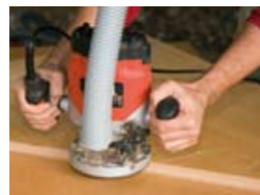
Også ved håndværktøj og de små opgaver er det nemt og hurtigt at etablere en udsugning, som effektivt fjerner støv og spåner. Når det er nemt - bliver det gjort.